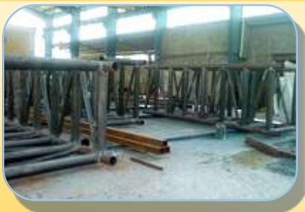
احداث پل هوایی در بلوار فرهنگ