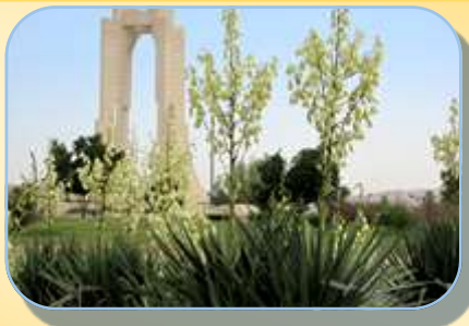
معرفی واحد فضای سبز شهرداری لار